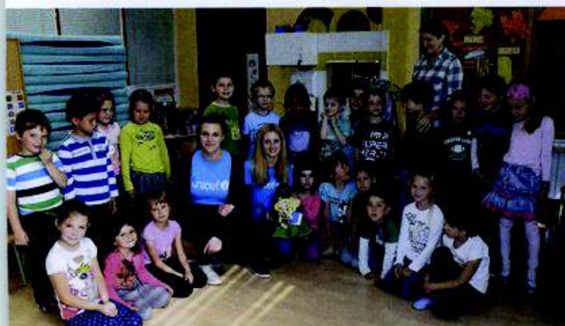
Otroci iz oddelka enote Izvir iz vzgojiteljico, prostovoljkama in punčko iz cunj.

pisavi, in dr. Viktorije Momeve Altiparmakovske iz Muzeja Bitola o tradicionalni podeželski arhitekturi makedonskega območja Popelisterje. Tudi kulturni program je bil s tamburaši Zelenjak pika na 'I' večkulturnim razstavam.