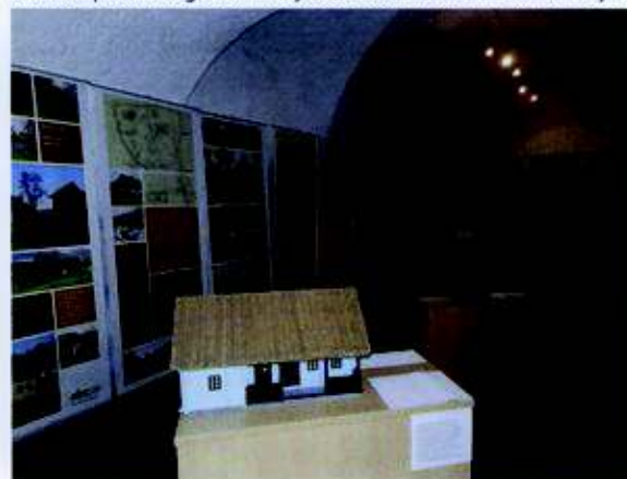
Arhitekturna dediščina Hrvaškega Zagorja od 20 let 20. stoletja naprej.