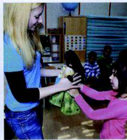
Punčka iz cunj bo pomagala otrokom v Afriki.