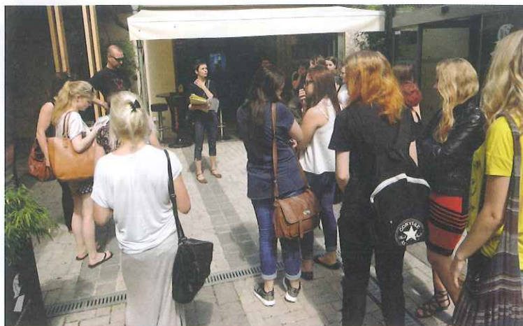
Le redki vedo, da je bila na območju današnjega Braniborja nekdaj konjušnica in da je bilo kasneje vse zapuščeno. S prenovo so naredili prijeten prostor druženja. Foto Metka Pirc

Na sprehodu, ki je bil odprt za najširšo javnost, so želeli mlade seznaniti z mestnim središčem in stavbami v njem ter zgodbami, kako je prišlo do njihove prenove. Ustvarjalci z zavoda Metro RS namreč upajo, da bodo mladi, ki bodo nekoč prevzeli zagon tudi v Celju, znali ohranjati te zgodbe.